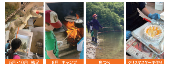
5月・10月 遠足 8月 キャンプ 魚釣り クリスマスケーキ作り

スイミングやサッカー以外にも 様々なスポーツや自然の中での 遊びを体験できる課外講座を 開催しています。